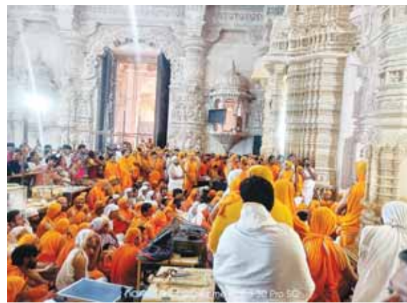
पहले प्रवचन देते हुए कहा आचार्य श्री का सपना था बड़े बाबा के दर्शन सभी को सहजता से हो। छोटे-छोटे दानदाताओं ने इतना विशाल बड़े बाबा का मंदिर बनकर खड़ा कर